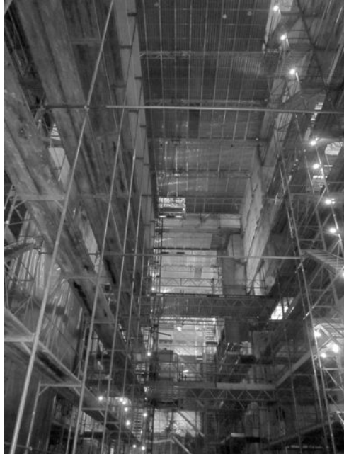
Der eingerüstete Kirchenraum. Oben die Arbeitsplattform für die Gewölbe

Die Jesuiten wurden im 17. Jh. von den führenden Familien Solothurns hierher berufen, um ihnen die Lateinschule zu übergeben, da die Stiftsschule den Ansprüchen nicht mehr zu genügen vermochte. Es entstanden nach und nach das Kollegium, das Gymnasium mit dem Theatersaal (heute Stadttheater) und 1680–88 die Kirche. Nach der Aufhebung des Jesuitenordens 1773 wurde das Kollegium als Professorenkonvikt in mehr oder weniger unveränderter Form weitergeführt. Bei den Umwälzungen um und