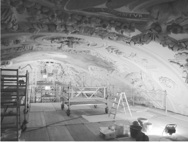
Unter dem Gewölbe. Im Hintergrund der Chorbogen mit Standeswappen, Justitia (r.) und Ecclesia (l.)

Soweit kam es zum Glück nicht, 1936 liess die Einwohnergemeinde im Rahmen von Notstandsarbeiten zur Beschäftigung von Arbeitslosen mit Bundesunterstützung die Fassade gegen die Hauptgasse restaurieren. 1952 konnte mit der Gründung der Stiftung Jesuitenkirche Solothurn eine Lösung der Eigentumsfragen gefunden werden, und der Weg war nun frei für die längst fällige Innenrestaurierung. Für die Otter-Orgel von 1794 hatte dies immerhin den Vorteil, dass man sie lange Zeit in Ruhe liess und nicht schon in den Dreissiger- oder Vierzigerjahren restaurierte. Allerdings stand die wirklich