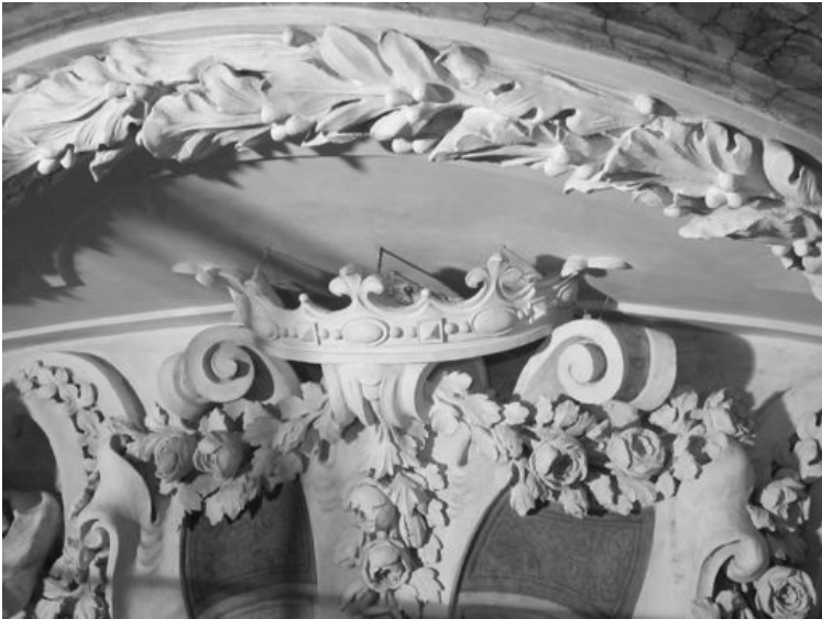
Krone über dem Standeswappen und Pflanzengirlanden am Chorbogen