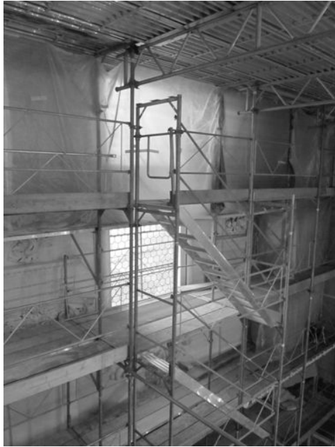
Ganz so wackelig, wie sie aussehen, sind die Treppen nicht...

Nach dem Aufstieg über die offenen Gerüsttreppen fanden wir uns gut 15 m über Boden unter der Decke im Angesicht der reichen Stukkaturen (Figuren, Früchte, Pflanzen) und der Malereien. Mit grosser Sachkenntnis erläuterte Herr Heeb die einzelnen Figuren und Bilder und wies auch auf die Spuren früherer Restaurierungen hin, die bei genauem Hinsehen aus der Nähe allenthalben sichtbar sind. Er erklärte auch die jetzigen Arbeiten: Für die Bilder Reinigung, Festigen abgeplatzter Schichten und